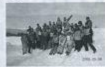
スキー/スノーボード