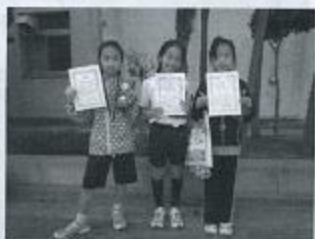
3月 千駄木マラソン

http://www.sensan-kita.org/shiomi_top.htm