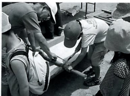
竹を使った水鉄砲作り

初めて役員をやって自分のためになったと思います。ストラックアウトのナンバーを入れるの球拾いをやりました。特にきつかったのはナンバーを入れることでした。ナンバーを入れて運ぶ作業までがストラックアウトの役員の仕事だったので、運ぶのも大変でした。