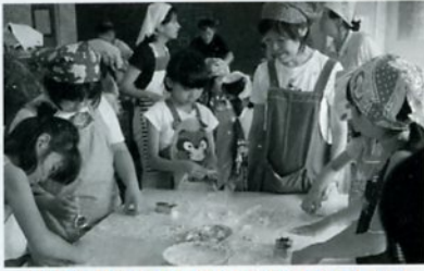
リボンやラビオリもたのしいね