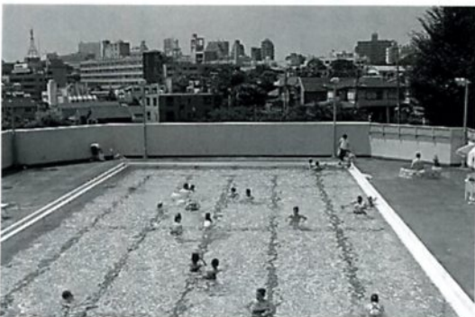
みんな気持ちよさそう～

毎年根津地区対と共催で行われるプール開放が、今年も第八中学校のプールを開放していただき、八月五～六日の二日間にわたり実施されました。両日とも快晴に恵まれ、30度C以上の気温のなか、延べで昨年より100名以上多い、262名が参加してくれました。