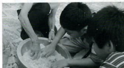
こなにおゆをいれてまぜます