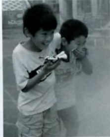
ホントの火事みたい!! けむいよ!