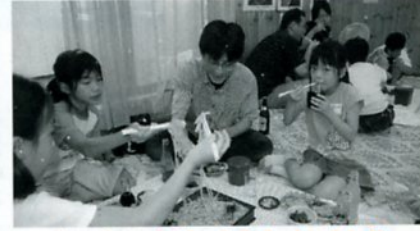
おいしいねたくさんたべよう