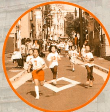
汐見：千駄木マラソン