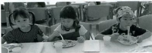
みんなてたべるとたのしいね