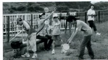
こうえんであそんだよ