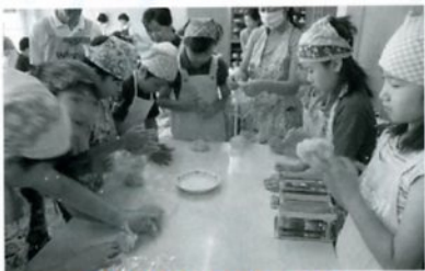
どんなのができるかな