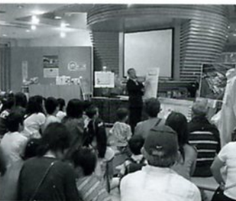
係員の説明を 真剣に聞く子ども達

八月九日に、明治牛乳工場へ見学に行きました。毎日のんでいる牛乳だけど、知らないことがいっぱいありました。一番始めのけんさは「受け入れ検査」です。細きんなどの数や風味を検査します。二番目は、「冷却・貯乳」という所です。そこでは、牛乳を冷やしてタンクに貯めておきます。三番目は、「清浄化」という所です。目に見えないゴミを外へ出してくれまです。四番目は、「均質化」という所です。細い所を通ることで、脂肪などを細かくしています。そのあとのパックをつめている所が一番おもしろかったです。工場なのに人が四、五人しかいませんでした。ほとんどきかいがやっていて、びつくりしました。帰りにプールに行きました。天気がわるくて、室内プールだったけど、おにごっこをしたのしかったです。朝から大ぜいの人とバスでかけて、たのしい一日でした。