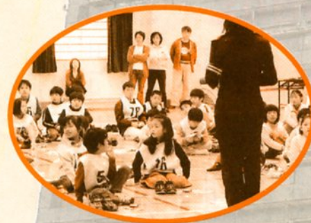
向丘：交通安全講習会