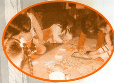
大塚：九地区合同行事