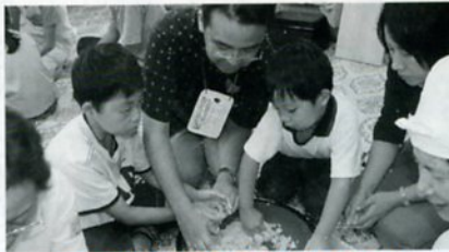
ぼろぼろからまるくなるよ