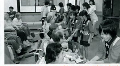
あくしゅうしたらてがあたかくなかったよ