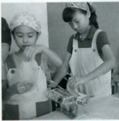
パスタマシンで伸ばします