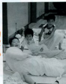
初めての お泊まり!!