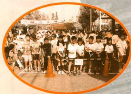
礪川：礪川マラソン