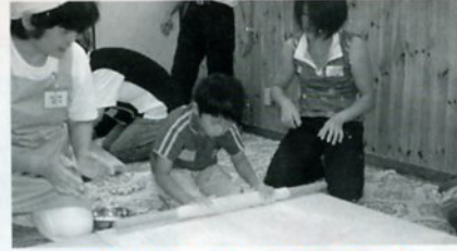
まるくなったらのばします