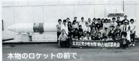
本物のロケットの前で

★つくばの山登りは、日頃の運動不足がたたりとてもハードでしたがのぼりきった後はとてもさわやかでした。息子もとても元気いっぱいで、いい気分転換になったようです。今日の山はきりが出た感じがした。ロケットのことをして、すごくよかったです。(鳥見親子)