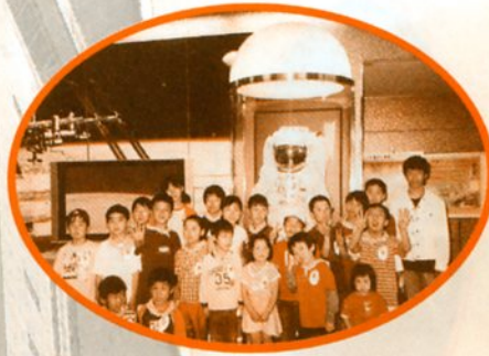
駒込：つくば山と 宇宙センター