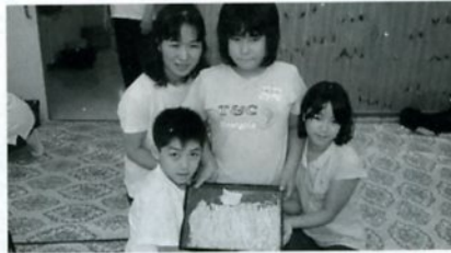
ほそくできたよゆでもらおう