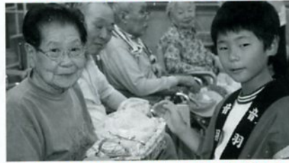
みんなで作ったさしこをプレゼント