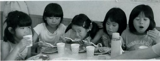
カレー・ホワイト・ミートソース