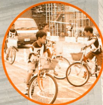
大原：自転車安全 実技講習会