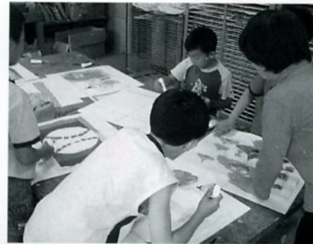
好きな絵を描くよ