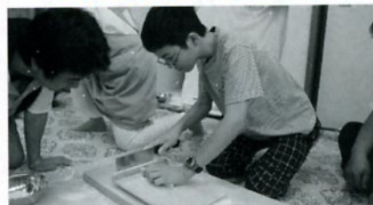
いたをあててきります