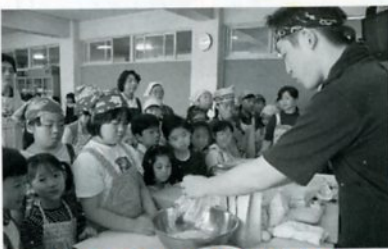
こねて こねて ねかせます